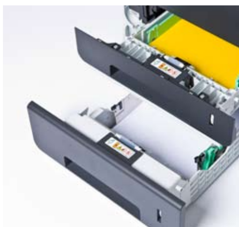
Komplettera med ett extra pappersmagasin för praktisk pappershantering

SSL-kryptering. Det tar bara några sekunder att skicka ett dokument från datorn till skrivaren. Men det räcker för att informationen ska hackas. SSL förhindrar detta genom att kryptera datan som du skickar inom nätverket.